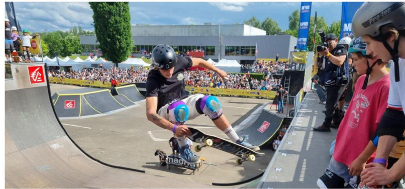
Le NL se poursuit dimanche avec du basket, du roller féminin et de la trottinette.

En dépit des orages et averses qui s'abattent ces derniers jours sur Strasbourg, le plus gros festival de sports et cultures urbains de la région tient bon.