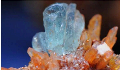
La fluorine entre dans la composition du dentifrice.

Soultz Haut-Rhin • La fluorine star du salon Kalitroc