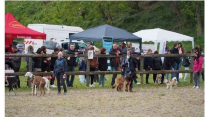
Parmi les animations, un concours canin.

Val-de-Moder • Les animaux ont leur festival