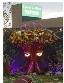
C'est la 24 e édition de Folie'Flora aux JO.

Parc des expositions, 120 rue Lefebvre à Mulhouse, jusqu'au 13 octobre. Ouvert tous les jours de 10 h à minuit (fermeture de l'accès une heure avant). Tarifs : JO 2 €/gratuit pour les moins de 7 ans ; JO + Folie'Flora : 8,50 €/7 € pour les 7-15 ans/gratuit pour les moins de 7 ans. www.parcexpo.fr Programme complet sur www.huningue.fr