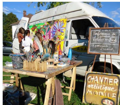
Ce dimanche 6 octobre, le public pourra participer à la réalisation de toiles collectives.

La Cie La collective Même Acabit, de Strasbourg, plongera les enfants, dès 7 ans, dans l'univers des contes revisités avec « Rose Biche ». Le thème de l'environnement sera décliné à travers des ateliers de boutures, de bombes à graines et un troc