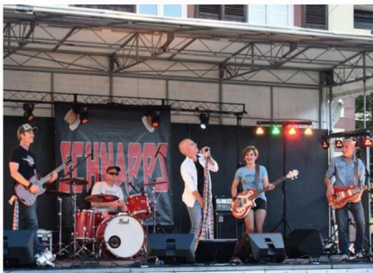
Le groupe de rock en alsacien Schnapps se produira samedi à 19 h à Durrenbach avec Serge Rieger et Stéphane Jost.

Pour montrer que le dialecte est bien vivant en Alsace du Nord et concrétiser sa délimitation en soutien à l'alsacien, la communauté de communes Sauer-Pechelbronn organise une semaine alsacienne jusqu'à ce dimanche 6 octobre autour de Woerth (les animations sont gratuites, sauf dimanche). L'occasion de mettre à l'honneur les forces vives dialectales du territoire, et d'espérer que d'autres habitants