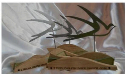
Les trophées des Schwälmele 2024, réalisés par Diane Philippe, Hervé Munsch d'AV-Lab, le fablab de Strasbourg, et Nicolas Tassart, de L'Alsacienne de Métallerie.

Créés par l'association e Frierhjoer fer unseri Sproch, les Schwälmele récompensent les personnes, associations, entreprises et communes qui s'engagent en faveur de la langue alsacienne. La 23 e édition se déroulera à Turckheim le 29 mars. Les candidatures sont ouvertes.