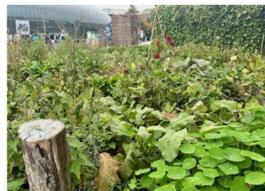
Le potager de la place de la Gare à Strasbourg, face à la verrière.

L'idée de la municipalité de planter des légumes sur la très passante place de la Gare ou à côté d'un feu rouge sur l'ancien rond-point de l'Esplanade a surpris, au printemps dernier, à Strasbourg. L'expérimentation a suscité une flopée de commentaires virulents sur le bien-fondé d'une plantation en plein centre-ville, dans la pollution et aux milieux des débris et autres mégots de cigarette. L'opposition s'en était saisie pour dénoncer une opération de com'.