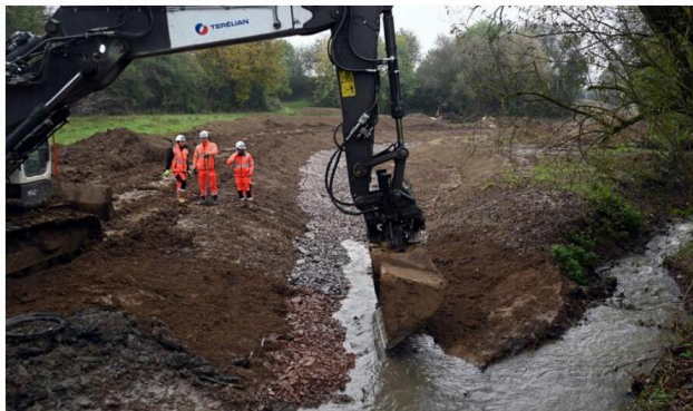
La pelle ouvre le chemin pour que le ruisseau du Heylenbach puisse couler dans son nouveau lit méandré.

Moment symbolique vécu ce mardi à Wasselonne. Le Heylenbach, affluent de la Mossig, a été détourné, sur 430 m, vers un nouveau lit plus respectueux de l'équilibre naturel d'un cours d'eau. Cet acte marquant s'inscrit dans un projet plus large de renaturation d'un ruisseau qui coule en grande partie sous la ville.