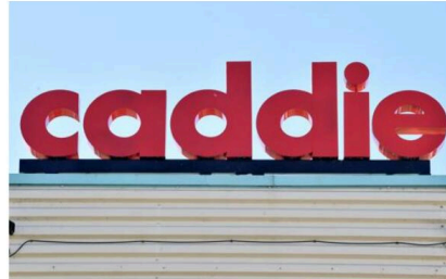
La portée du nom « Caddie » excède largement l'entreprise elle-même et attire les convoitises.

Connue en Alsace pour son histoire industrielle, le quasi centenaire, Caddie est aussi une des rares marques qui a donné, dans le langage courant, son nom à un objet. En l'occurrence le chariot de supermarché, que l'entreprise fabriquait jusqu'à peu. Suite au placement en liquidation judiciaire de la société, l'été dernier, ses différents actifs sont depuis peu proposés à la vente, comme c'est l'usage dans cette procédure.