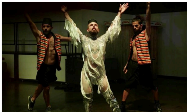
Quatre films à voir dans la section « Berlin, creuset des luttes des minorités de genre », des années 1970 à aujourd'hui.

Augenblick reçoit deux invités cette année : la documentariste autrichienne Ruth Beckermann, dont le nouveau film, Favoriten , sur des enfants immigrés dans une école de Vienne, inaugurera le festival. Et le réalisateur allemand Rudolf Thome, peu connu en France, dont les films seraient