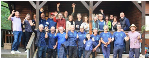
Les membres du cyclo club Les Hirondelles savent allier « cardio, dépassement, et amusement » tout en contribuant à entretenir les sentiers.

En 2009, l'ASPPT VTT et Les Hirondelles ont fusionné, tout en gardant leur petit nom d'oiseau, qui leur vient de l'un des fondateurs qui était policier municipal. Les