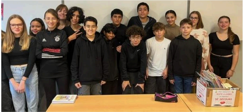
Am Schulanfang hat eine Deutschlehrerin am College Galilée in Lingolsheim diese Frage ihren Schülern der 4e gestellt: Warum lernt man Deutsch in Europa?

Die Collège-Schüler, die dem Erlernen der deutschen