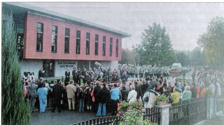
Inauguration de l'école André Weckmann à Roeschwoog (2004).