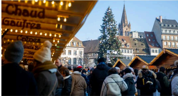
Le marché de Noël strasbourgeois a accueilli 3,4 millions de visiteurs en 2024.

Parmi ces 3,4 millions de visiteurs, 53 % sont originaires de l'extérieur de la métropole : principalement d'Ile-de-France, de Moselle et Meurthe-et-Moselle, ainsi que du département du Nord. Les touristes