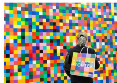
L'un des clichés de la série "Art'mateurs" choisis par Philip Anstett : une visiteuse de l'exposition Gerhard Richter à la fondation Beyeler de Riehen, en 2014.